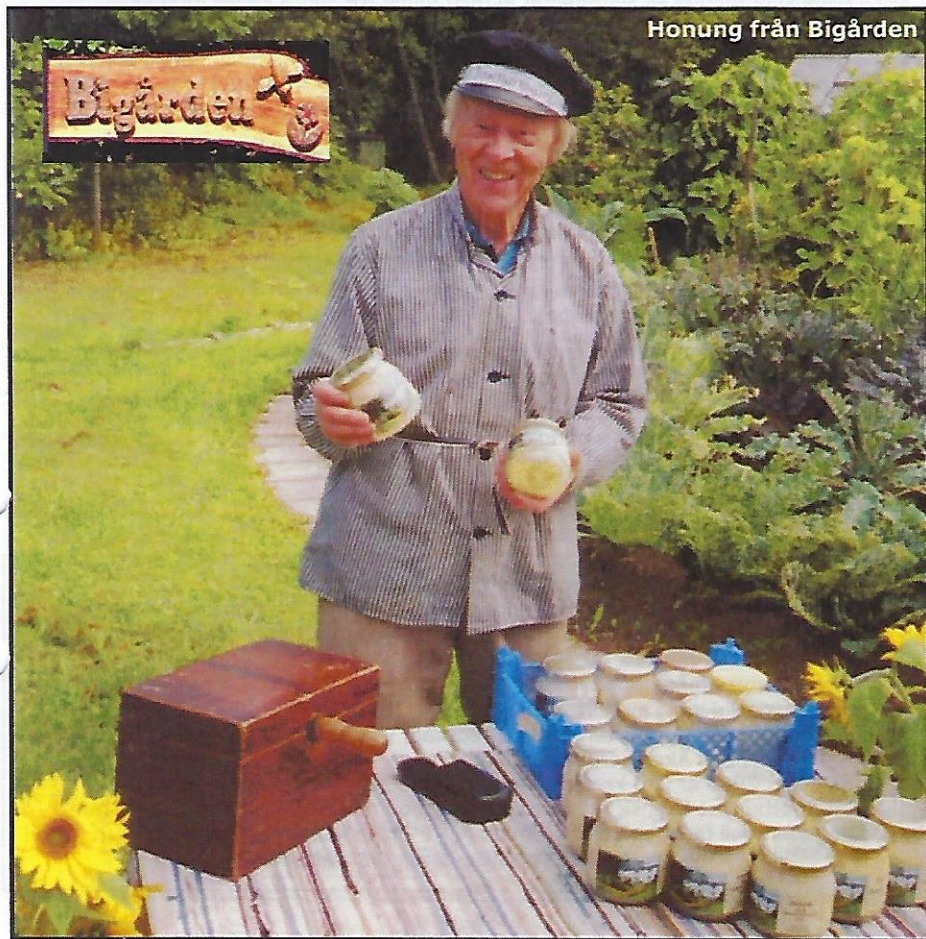
Honung från Bigården