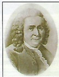
Carl von Linné 1707 - 1778