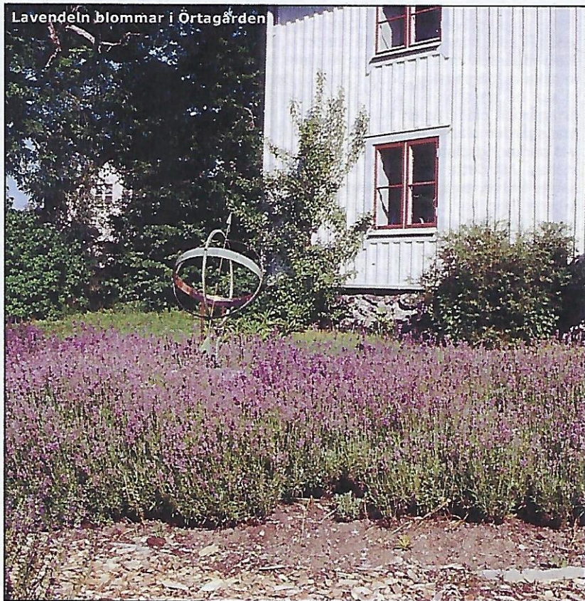
Lavendeln blommar i Örtagården